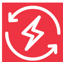
Zrównoważona gospodarka i energia

biogospodarka | nowe materiały, odzysk materiałów | przesyt i magazynowanie energii | materiały budowlane o niskiej energochłonności i materiałochłonności oraz wysokiej izolacyjności | zrównoważone procesy upraw | zielona chemia